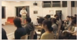
リハケア理論を学ぶスタッフ。