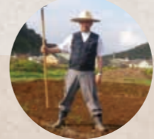
リハケアファームプロジェクト開始