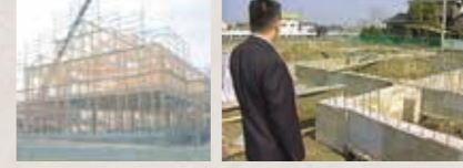
本社建築中の様子 「気」を大切に考え、炭素埋設(埋炭)を行い、土地にマイナスイオンを集め良いエネルギーを充滿させました(イヤシロチ化)。