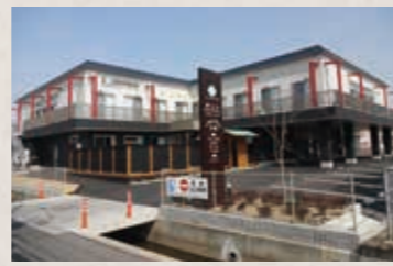
赤いラインが特徴的な創心会リハケアタウン北館。デイサービスやショートステイ、保育園があり、地域と溶け合う施設としてオープン。