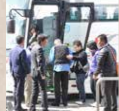
創心会メデイケアセンター 創心会グループ初の医療機関。2階にデイサービスを併設。