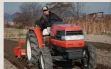
誰もが活躍できる場としてできたファーム。現在では、イチゴの栽培、キャベツのカットなどを行っています。